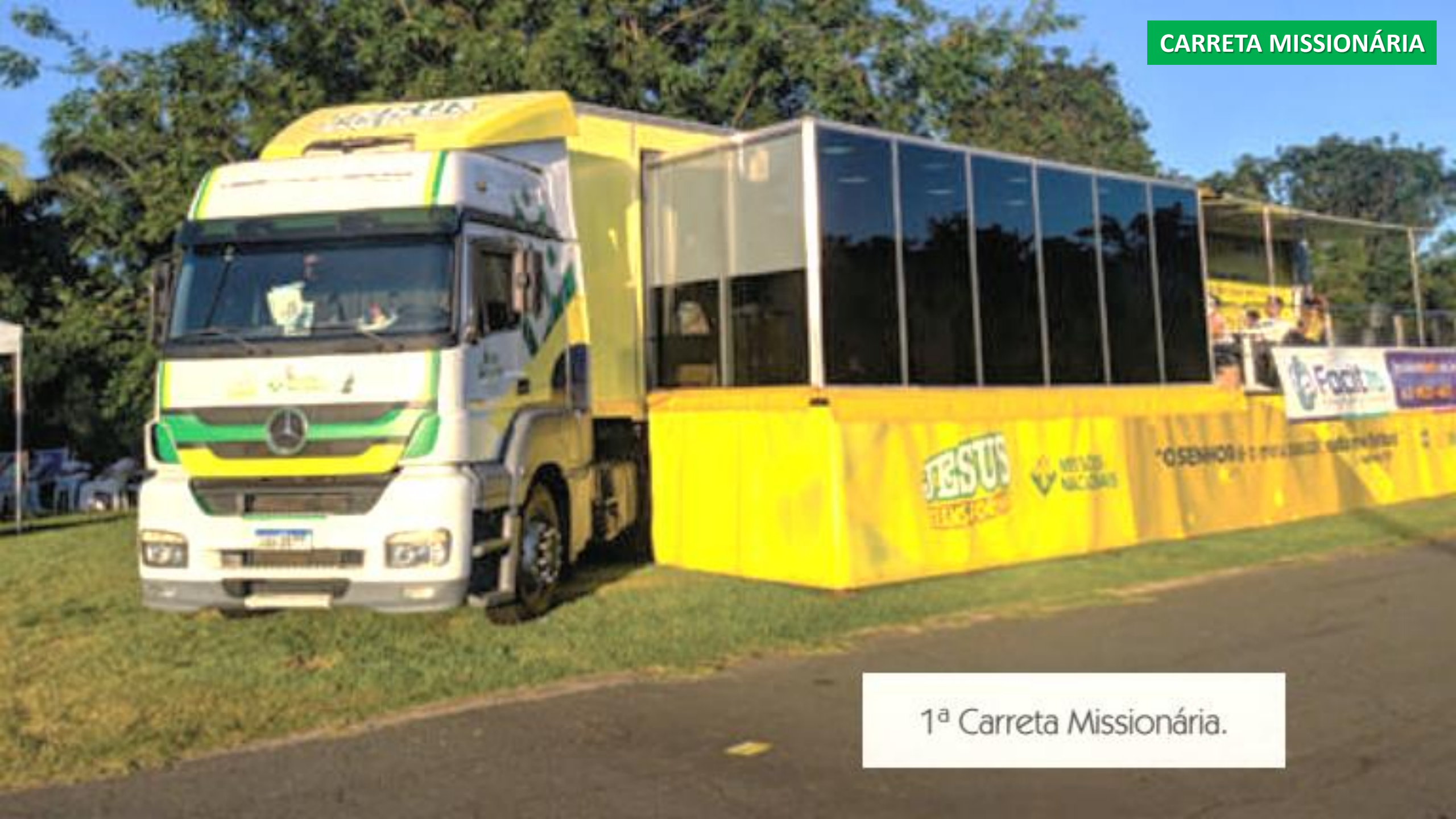
1ª Carreta Missionária.